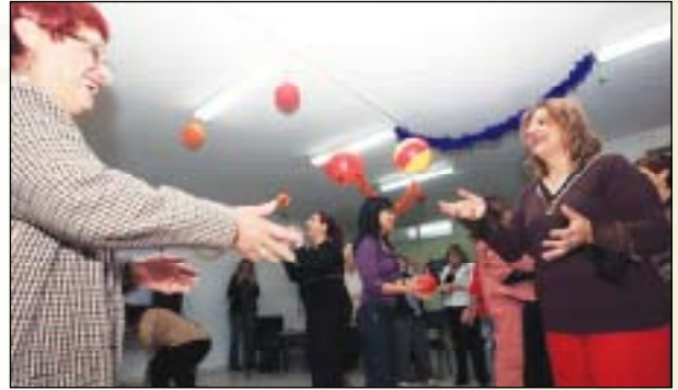
"יום האישה" בסניף ראשון לציון