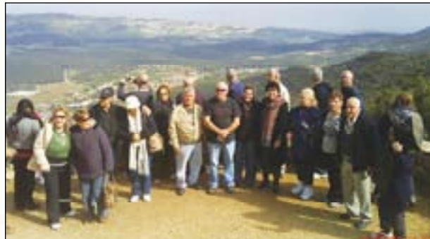
חברי הסניף על הר מירון

סניף באר-שבע טייל בצפון - באביב השנה יצאו חברי סניף באר-שבע לטיול לצפון לסוף שבוע שכלל: ביקור בנחל אלכסנדר, מוזיאון החאן בחדרה, מוזיאון ראלי בקיסריה, בעיר בצפת ובחיפה. החברים נהנו מאוד מהטיול המקסים בצפון.