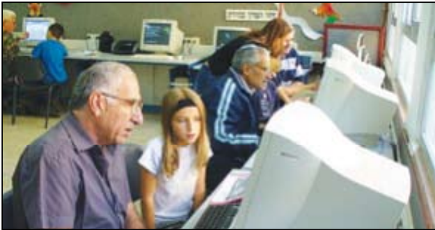
מרגש לראות את הקשר האישי בין הילדים לגמלאים