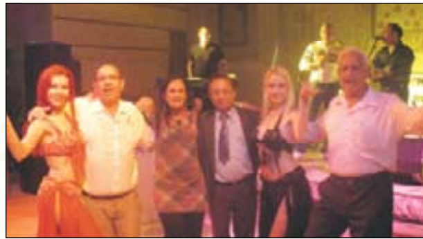
שרים עצמאות בהוד-השרון

טיול לכפר חב"ד - לקראת חג הפסח, ערכנו טיול לכפר חב"ד כדי לעמוד מקרוב על מנהגי החג. בביקור בבית הרבי מלובביץ', אשר הינו העתק מדוייק לביתו שנמצא בברוקלין, חזינו במצגת נאום הרבי. במאפיית מצות וצפינו