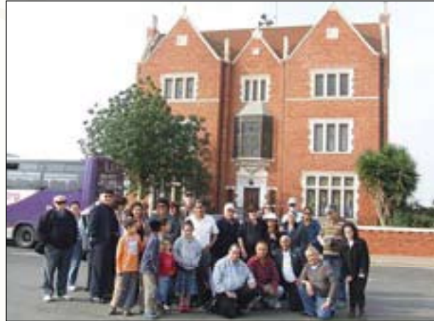
ליד בית הרבי בכפר חב"ד

טיול לכפר חב"ד - לקראת חג הפסח, ערכנו טיול לכפר חב"ד כדי לעמוד מקרוב על מנהגי החג. בביקור בבית הרבי מלובביץ', אשר הינו העתק מדוייק לביתו שנמצא בברוקלין, חזינו במצגת נאום הרבי. במאפיית מצות וצפינו