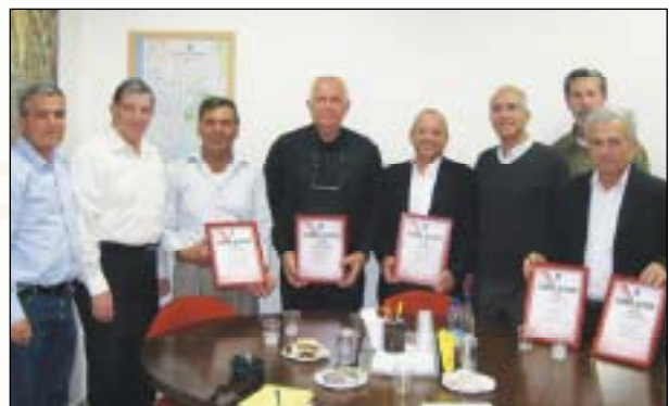
חברים מסניף אשקלון הוענקו תעודות הוקרה על פעילותם בתקופת מבצע "עופרת יצוקה"