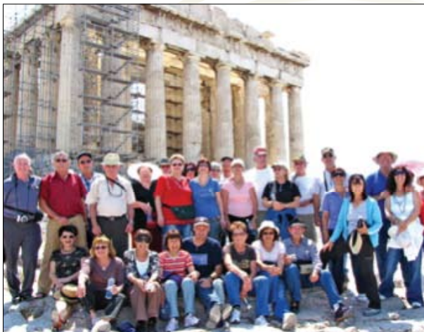
חברי סניף הרצליה ליד הפרתנון באקרופוליס של אתונה בסוף מאי 2009