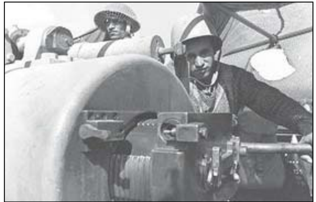
תמונות ממלחמת ההתשה ליד גדות תעלת סואץ (1969-1970)

הכתבה המלאה, כולל המאבק בטרור הפלסטיני, מופיעה באתר "צוות".