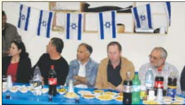
חברי סניף דימונה מרימים כוסית לכבוד יום העצמאות