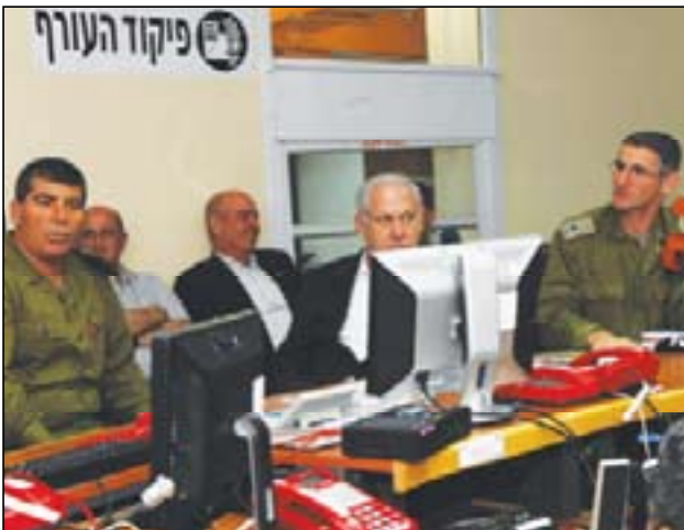
ראשי הקבינט הביטחוני בראשות ראש הממשלה, בנימין נתניהו, התארחו בצה"ל וביקרו במפקדת פיקוד העורף ברמלה, במסגרת תרגיל "נקודת מפנה 3". הם שמעו סקירות מפי הרמטכ"ל, רב-אלוף גבי אשכנזי, סגן שר הביטחון, מתן וילנאי ומפקד פיקוד העורף, אלוף יאיר גולן