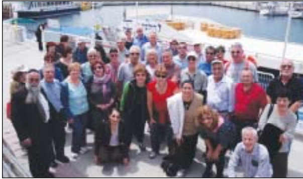
חברי סניף ראשון באשדוד