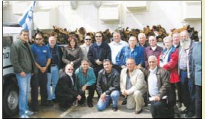
חברי הוועדה מבקרים ב"תערוכת הקסאמים" במ"י בשדרות