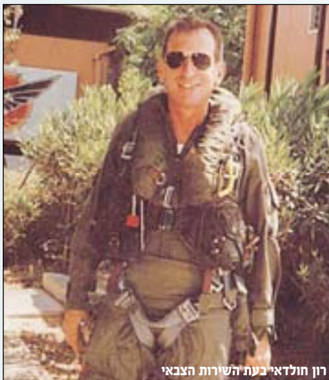
רון חולדאי בעת השירות הצבאי

למעלה מ-10 שנים משמש רון חולדאי (תא"ל) כראש עיריית תל אביב - המרכז המטרופוליטני והמסחרי של ישראל. בתקופת כהונתו חזרה העירייה לאיזון תקציבי, החלה הגירה חיובית של תושבים, ו"הפריחה התרבותית" נראית בכל מקום. בין אנשי הביצוע אשר עזרו לחולדאי להגשים את חזונו, ניתן למצוא לא מעט פורשי צה"ל - ולא בכדי. "זה לא בגלל העיניים היפות של אף אחד, אלא מתוך הבנה והכרה של 'בית הגידול' של אותם אנשים"