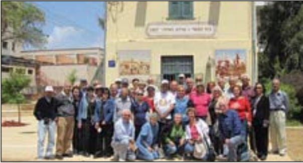
החברים מפתח-תקוה ליד מוזיאון "בית הבאר" בנתניה