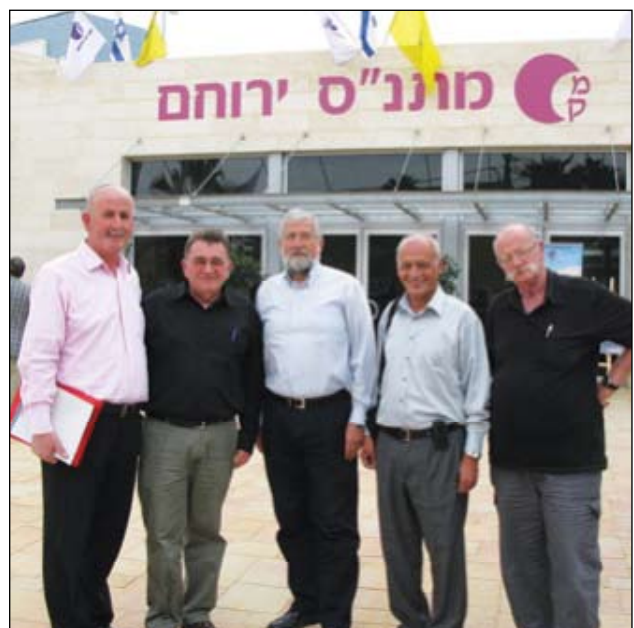
מצנע (במרכז) עם חברי "צוות" נווה, אופיר, שני ופחימה בחזית המתנ"ס המחודש

במסגרת הפיילוט יוקמו יחידות דיור ל-50 משפחות אנשי קבע. צה"ל, משרד הביטחון ומשרד האוצר, החליטו ליצור תקדים לפיו היחידות ייבנו ויעמדו לשכירות שתסובסד במלואה על-ידי משרד הביטחון. המטרה היא לתת לאיש הקבע ולמשפחתו להתנסות, להכיר את איכות החיים, ואז להחליט