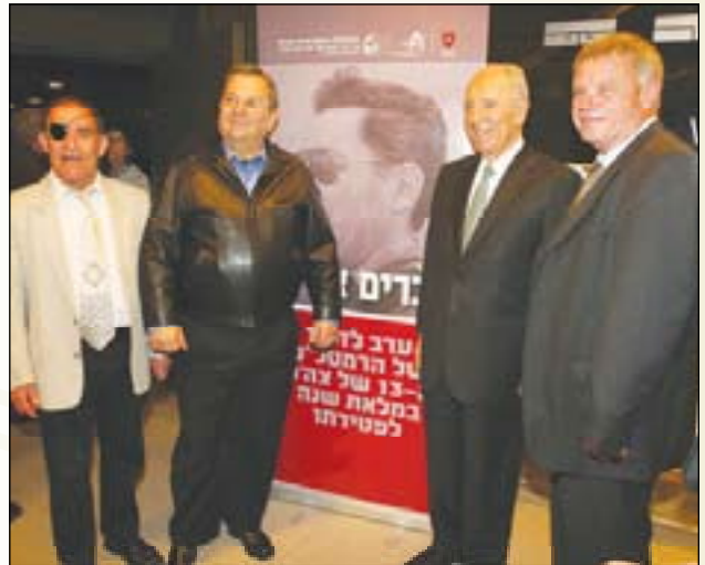
בתמונה: המנכ"ל זאב דרורי, נשיא המדינה שמעון פרס, שר הביטחון אהוד ברק ונשיא מכללת כנרת פרופ' חנוך לביא

המועצה אישרה גם תיקונים לתקנון "צוות", שעל-פיהם ניתן יהיה למנות לתפקיד גזר במחוז גם חבר "צוות" שלא נבחר למועצת המחוז וכן מינוי לגזר ומזכיר סניף, גם חבר שלא מקרב חברי הנהלת הסניף. המשמעות הינה שניתן יהיה למנות לתפקידים אלה גם חברי "צוות" מהשורה, שלא נבחרו למוסד הרלוונטי במחוז או בסניף, אם יש להם את הכישורים המתאימים למילוי תפקידים אלה.