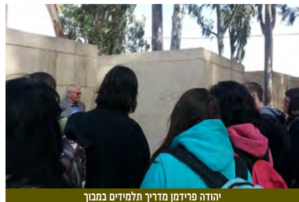
יהודה פרידמן מדרך תלמידים במבחן