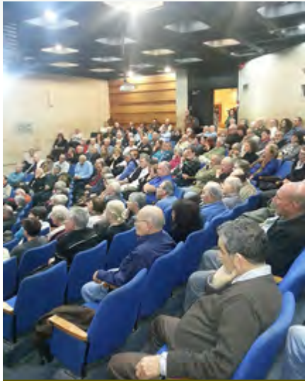
חברי 'מועדון חבצלת' מקשיבים לספור המגילות