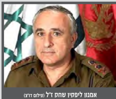
אמנון ליפקין שחק ז"ל

רב אלוף אמנון ליפקין שחק, ראש אמ"ן לשעבר והרמטכ"ל ה-15, הלך לעולמו ביום רביעי ו' בטבת תשע"ג 19 בדצמ' 2012, לאחר מאבק ממושך במחלת הסרטן. אמנון קבל פעמיים את עיטור העוז, הראשונה כמפקד סירת דוכיפת בפעולת כראמה (1968) והשנייה על תפקודו במבצע "אביב נעורים" בבירות (1973). אמנון פיקד על מבצע שלמה (1991) להעלאת יהודי אתיופיה לישראל כסגן הרמטכ"ל. בן 68 היה במותו. הניח אחריו אישה וחמישה ילדים. יהי זכרו ברוך.