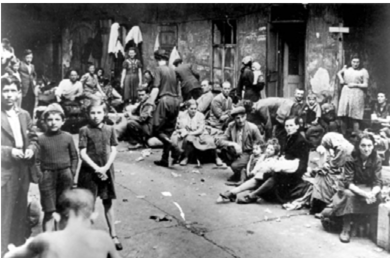
ניצולי הפוגרום בקייילצה, פולין, ממתנינים להעברתם מחוץ לפולין, קיץ 1946.

עם תום מלחמת העולם השנייה החליטו ניצולי 'שואה' "לברוח" מאירופה, שהפכה בעיני רבים ל"בית קברות יהודי גדול" ולעלות לארץ ישראל, כדי להקים בה את ביתם. בדרכים, בין הרים, גבולות ובמחנות מעבר עשו את דרכם כ-300 אלף פליטים ממזרח אירופה אל נמלי הים התיכון, אל האוניות שיישאו אותם לישראל. תנועת "הבריחה", שדאגה להעביר את ניצולי 'השואה' בדרכי יבשת אירופה, ותנועת "ההעפלה", שהשיטה אותם בנתיבי הים התיכון, פעלו שתייהן במחתרת, באופן לא לגאלי, תחת הגג של "המוסד לעלייה ב". שורשי "הבריחה" בהתארגנות ספונטאנית של ניצולי 'השואה', שיצאו מן המחנות, מן היערות וממקומות המסתור והחלו להתארגן לעזרה הדדית. אחר-כך נפגשו הניצולים עם חיילי "הבריגאדה היהודית" של הצבא הבריטי, שנצלו את מעמדם ואת האמצעים שעמדו לרשותם לסייע לאחיהם. בהמשך, שלח "המוסד לעלייה ב" בראשות שאול אביגור, שליחים מהישוב בארץ ישראל לארצות אירופה לנהל ולפקד על "הבריחה". ארגון "הבריחה" טיפל בהיבטים הלוגיסטיים: הסעה המונית ברכבות ומשאיות מעיר לעיר ומארץ לארץ; הנפקה של רכבות תעודות מזויפות; חציית מעברי גבול בעזרת שוחד או הברחת גבולות ברגל, בקור ובשלג, וטוויית רשת של נתיבים ומחנות מעבר על פני אירופה כולה. בין העולים היו אלפי ילדים יהודים יתומים שנאספו, נפדו או חולצו על ידי ארגון "הבריחה" ממנזרים, ממשפחות נוצריות, ממערות וממחבואים ברחבי אירופה. ילדים אלה היו זקוקים לטיפול, לדאגה, לחינוך ולאהבה, שנשללו מהם בשנות המלחמה.